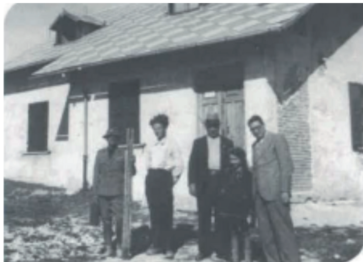
L'ex rifugio è ora urbanizzato come civile abitazione ed è di proprietà della famiglia Croci.

Tra il 1910 ed il 1935 il CAI Roma ebbe un rifugio-stazione invernale su un colle a Ovindoli (Sirente) intitolato a Carlo Franchetti, alpinista e speleologo che ne aveva finanziato la costruzione. Veniva utilizzato come punto d'appoggio per le attività sciistiche (importanti le manifestazioni del 1913, 1926, 1928), ed alpinistiche. Il 27/3/1923 il Consiglio Direttivo del CAI Roma ne affidò le spese e la gestione, spesso in passivo, al Presidente del Gruppo Romano Sciatori. Nel 1926 fu costruita una nuova struttura sul colle "Le Aie" di Ovindoli (adesso via Giuseppe Faelli 27), che dominava dall'alto le discese "i Prati" dove si sciava, con vista su pizzo Ovindoli, la Magnola, il Sirente ... Inizialmente era proprietà della famiglia Franchetti, poi il Rifugio Franchetti a Ovindoli, archivio CAI L'Aquila. Sottosezione Altipiano delle Rocche 10/10/1930 fu comprata ufficialmente dal CAI Roma per 20.000 lire. Il rifugio venne frequentato da personalità come Enrico Fermi (che usava l'acqua di Valle d'Arano, ricca di ferro e minerali, per gli esperimenti sulla scissione dell'atomo), la principessa Giovanna di Savoia figlia del Re Vittorio Emanuele II (in occasione delle gare di sci: "ludi ginnici invernali dei discepoli delle scuole medie", organizzate dal CAI Roma per la coppa Giuseppino Faelli), Galeazzo Ciano e naturalmente il barone Carlo Franchetti. Nel 1935 il rifugio fu venduto a Giovanni Croci per 18.000 lire.